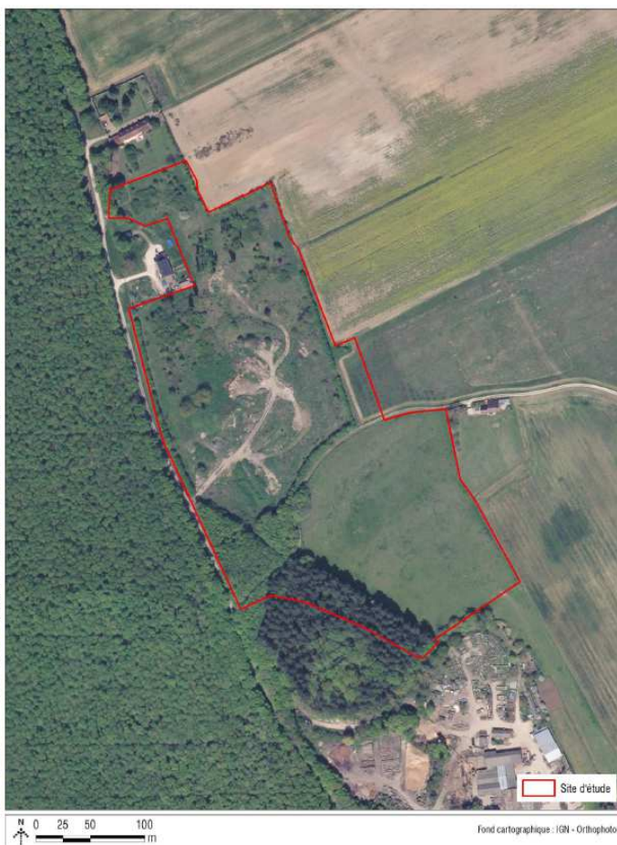
Illustration : Vue aérienne de l'emprise du projet de centrale photovoltaïque

Le projet concerne un site d'environ 5,5 ha, au lieu-dit « La Grange Rouge », localisé à proximité immédiate de la forêt de Russy et d'une scierie. Le site est divisé en deux parties distinctes :