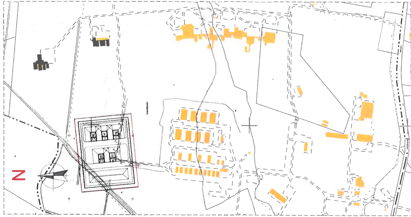
Extrait du cadastre Ech: 1/5000