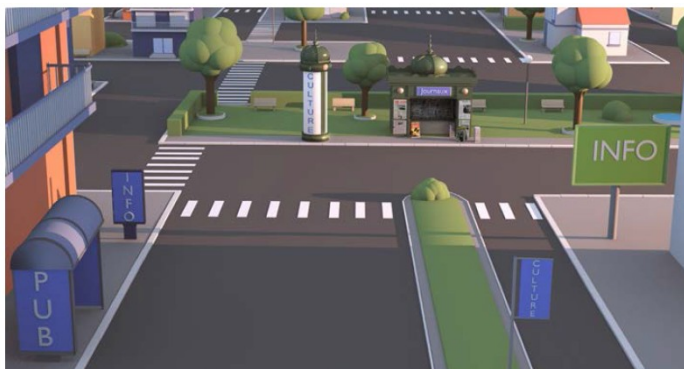
Les différents types de mobilier urbain pouvant accueillir de la publicité : l'abri bus (portant la mention PUB), le kiosque à journaux (au fond), la colonne porte-affiche (à gauche du kiosque), le mât porte-affiche (portant la mention culture) et deux mobiliers recevant des informations non publicitaires à caractère général ou local (portant la mention info) : un de 2 m 2 (communément appelé sucette) et un de 8 m 2 .