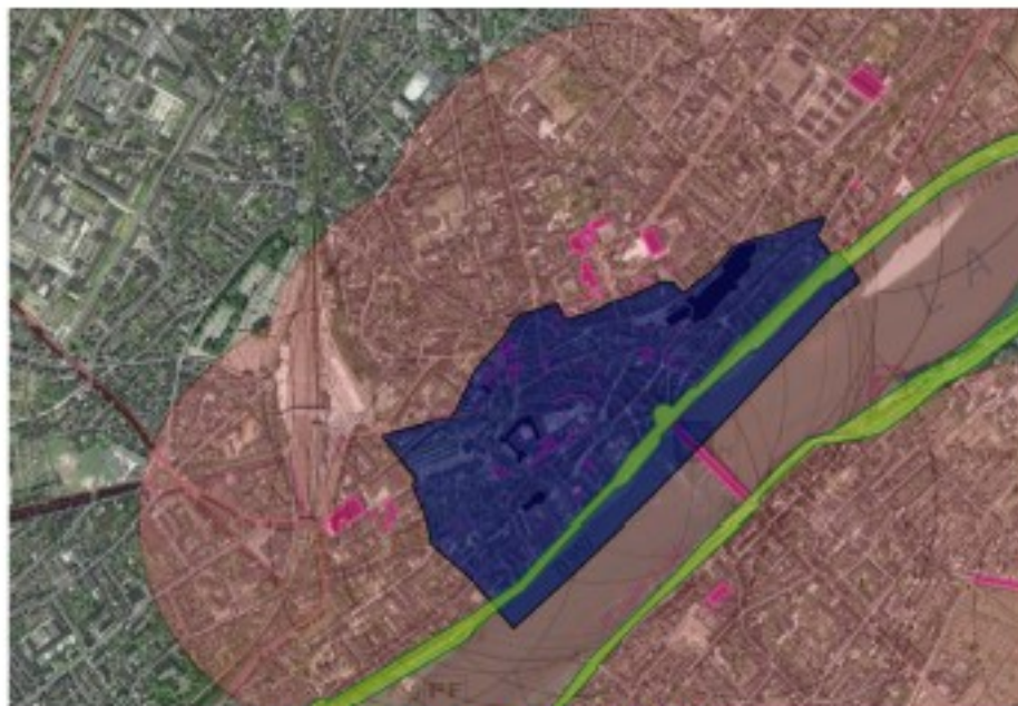
Secteur sauvegardé de Blois (en bleu)