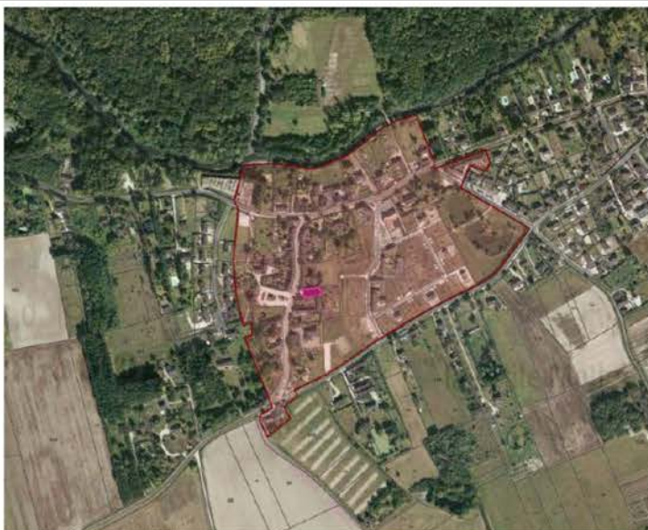
Périmètre de protection modifié de l'église Saint-Etienne de Tour-en-Sologne