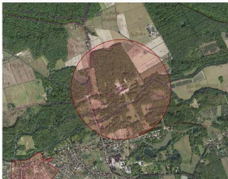
Périmètre de protection du château de Villesavin à Tour-en-Sologne