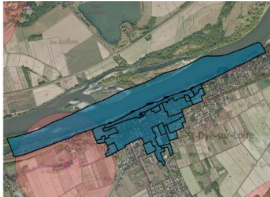
ZPPAUP de Saint-Dyé-sur-Loire